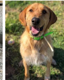
Ribellu/m, geb. 11.10.16 griffon fauve de Bretagne im TH seit 6.5.18