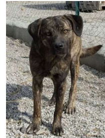
Gringo/m, 25.8.13 Cursinu im TH seit 4.2.16

142 Hunde wurden in diesem Vereinsjahr vermittelt und fanden ein neues Zuhause. Welch eine super Quote! Es suchen aber immer noch, besonders ältere Hunde verzweifelt ein neues Domizil. Hier eine kleine Auswahl der wartenden Kandidaten: