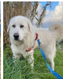
Tiger/m, geb. 15.5.15 montagne de Pyrénées im TH seit 17.12.15