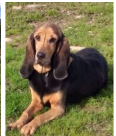
Dolly/w, geb. 25.6.10 bruno du Jura im TH seit 28.3.15