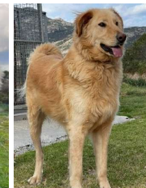
Oz/m, geb. 20.3.18, croisé berger des Abruzzes/Golden - Retriever, im TH seit 30.12.20