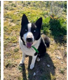
Falco/m, geb. 30.4.15 croisé Ours de Carélie